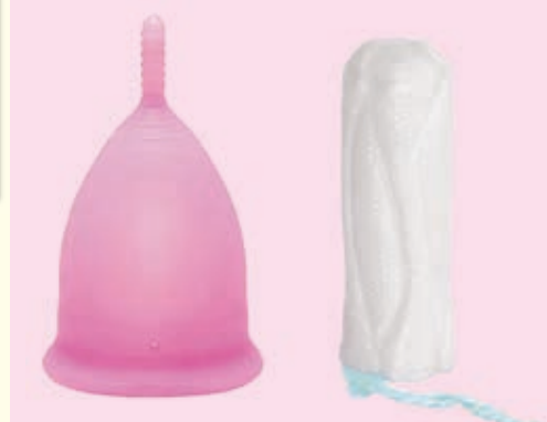
Größenvergleich MiniCup (XS) und Tampon

Wir arbeiten im Team ständig an Innovationen, neuen Produktideen und haben jetzt – ganz NEU – den MiniCup – besonders klein für Teenies und Frauen, die kleine Größen brauchen.